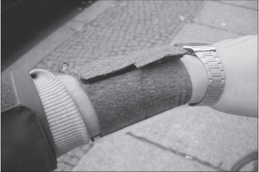
Abbildung 1: Das Smartband

Als Sensor-Armband zur Messung des Hautwiderstandes bzw. der Hautleitfähigkeit wurde in den ersten Begehungen ein Prototyp des „smartband“ von „bodymonitor“ eingesetzt, das zur Aufzeichnung von Vitalparametern entwickelt worden ist. Es handelt sich hierbei um ein Armband, welches mittels Mikroprozessoren und Sensoren den Hautwiderstand der Probanden aufgezeichnet. Im späteren Versuch wurde das „SenserWear-Armband“ der Firma „BodyMedia“ genutzt, welches bereits in mehreren klinischen Studien für metabolisches Aktivitäts- und Lebensstil-Monitoring zum Einsatz kam und neben dem Hautleitwert auch die Hauttemperatur misst sowie aufgrund der triaxialen Beschleunigungssensoren Bewegungstypen (wie z. B. Rennen, Sitzen, Schlafen) identifiziert.