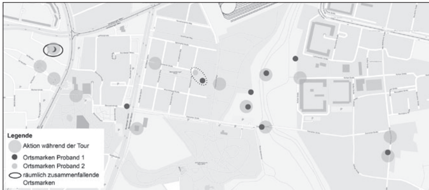
Abbildung 3: Alle Ortsmarken beider Probanden – nur einmal zeigt sich eine räumliche Nähe (eigene Darstellung)

welche er mit einem Logpunkt markiert hat, von jenen, welche unwillkürlich seine Aufmerksamkeit erregt haben (Hautreaktionswerte). Bei Proband 2 ist hingegen zu erkennen, dass subjektives Urteil und automatisch-emotionale Reaktionen zeitlich eng zusammen liegen. Die unwillkürlich-körperlichen Reaktionen des Probanden 2 sind damit relativ konsistent mit seinem bewussten Urteil (vgl. Abb. 4). Zudem deuten die Ergebnisse darauf hin, dass äußere Einflüsse (wie etwa die Aktionen) auf den Hautleitwert der Probanden Einfluss nehmen.